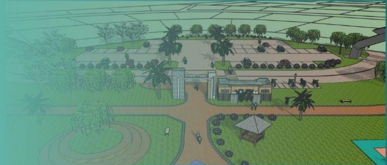
Taman Rekreasi Machap