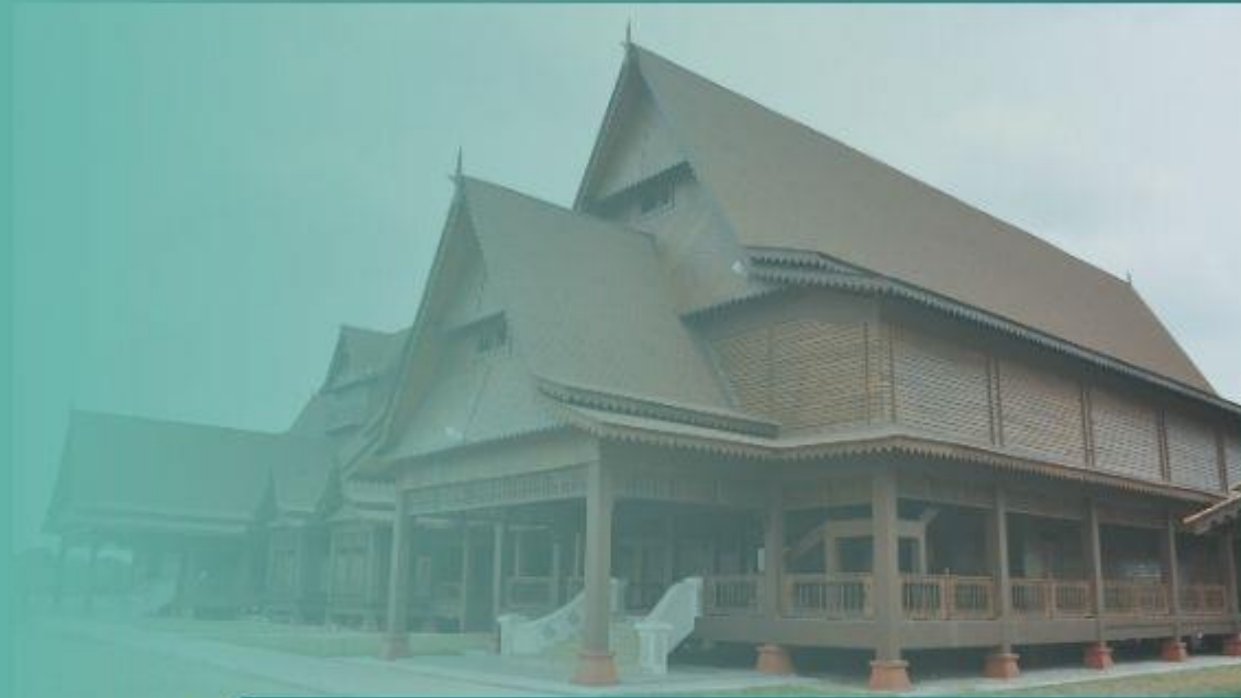
Perkampungan Hang Tuah